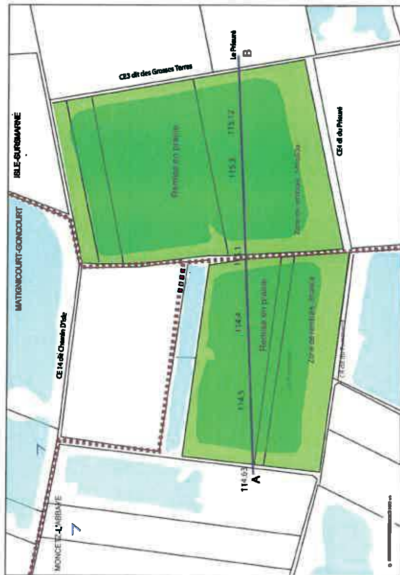
Coupe AB en en fin d'exploitation